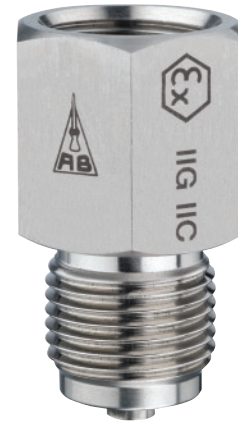
Adapt FS Variante 1

Variante 5: fest eingeschweißt in Manometerkörper